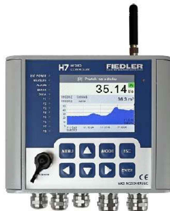
REGISTRAČNÍ JEDNOTKA FIEDLER H3/7